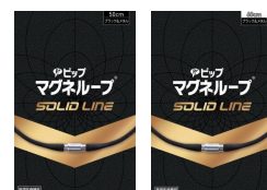
販売名 ピップマグネループEX