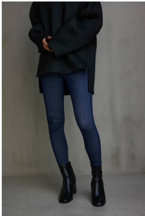
【COLOR : BLU】