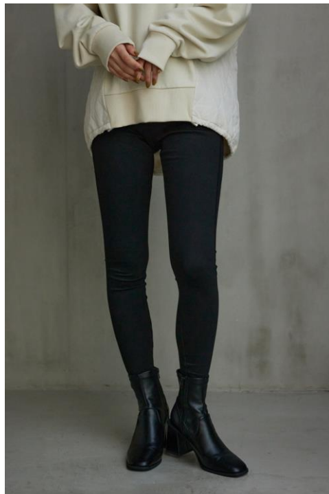
【COLOR : BLK】