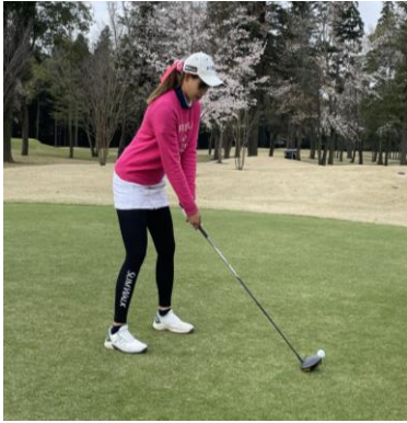
オリジナルの「スリムウォーク Beau-Acty 美脚&美尻レギンス」を着用している選手の様子

◆着圧レッグウェアブランド「スリムウォーク」では、ロゴ入りオリジナルの「スリムウォーク Beau-Acty 美脚&美尻レギンス」を提供し、プレー中に着用していただきました。