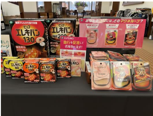
血行を改善しコリを解消するブランド「ピップエレキバン」「ピップマグネルーブ」のブースの様子