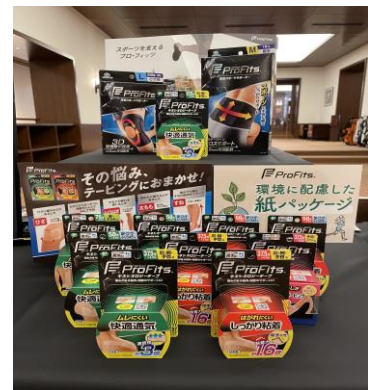
スポーツケア用品ブランド「プロ・フィッツ」のブースの様子