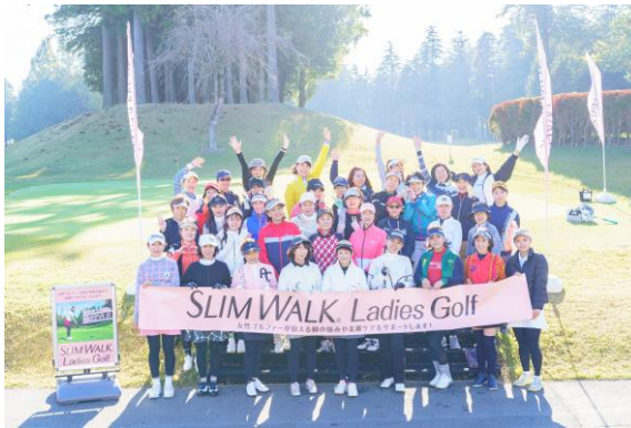
（昨年開催したSLIMWALK Ladies Golfの様子）

ピップ株式会社（本社：大阪市中央区、代表取締役社長：松浦由治）の着圧レグウェアブランド「スリムウォーク」は、2022年より「ゴルフ女子応援プロジェクト」を開始し、製品提供やゴルフ大会の開催など様々な活動を通じて、女性ゴルファーが抱える脚のお悩みや美脚ケアをサポートしています。昨年も好評のお声をいただいた『SLIMWALK Ladies Golf』を、2024年11月29日(金)に千葉県・四街道ゴルフ倶楽部（アコーディア・ゴルフ）で開催します。本ゴルフイベントは、初心者でも気軽に参加ができるよう、スコアを競わず楽しめる内容となっています。また、「スリムウォークゴルフ美脚&美尻レギンス」「スリムウォークゴルフ美脚ハイソックス」「美脚あったかタイツなめらかタッチ」のいずれかを参加者全員にプレゼントするなど、豪華特典もご用意しています。